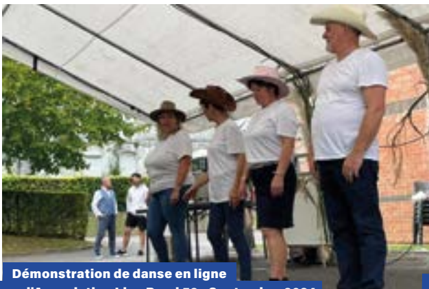
Démonstration de danse en ligne par l'Association Line Road 59 - Septembre 2024