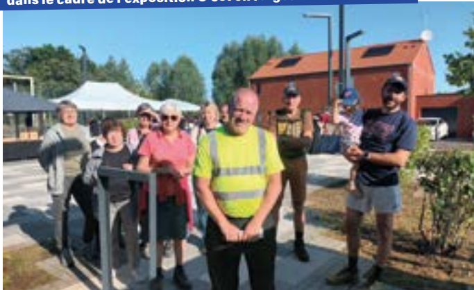
Randonnée familiale, circuit découverte au tour des forges d'Anor dans le cadre de l'exposition C'est en forgeant... - Juillet 2024