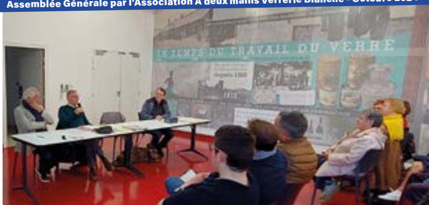
Assemblée Générale par l'Association A deux mains Verrerie Blanche - Octobre 2024