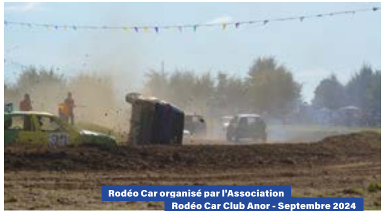
Rodéo Car organisé par l'Association Rodéo Car Club Anor - Septembre 2024