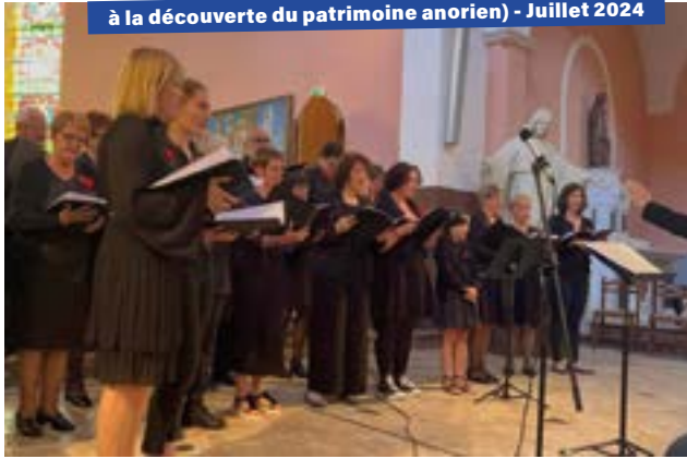
et l'École Municipale de Musique (circuit pédestre à la découverte du patrimoine anorien) - Juillet 2024