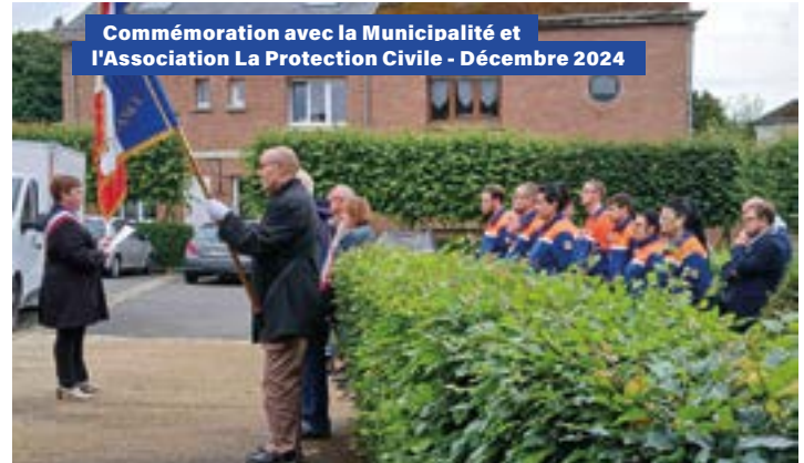
Commémoration avec la Municipalité et l'Association La Protection Civile - Décembre 2024