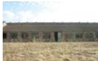
Salle Grimbart avant

La Commune d'Anor a été retenue pour l'excellence de son dossier et sera présente à Paris lors de ces journées organisées par l'ADEME (Agence de l'Environnement et de la Maîtrise de l'Énergie).