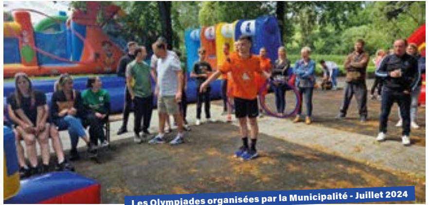
Les Olympiades organisées par la Municipalité - Juillet 2024