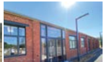
Salle Grimbart après