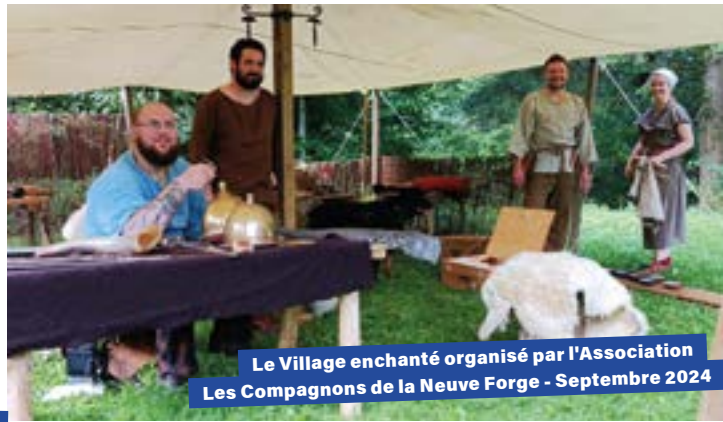
Le Village enchanté organisé par l'Association Les Compagnons de la Neuve Forge - Septembre 2024