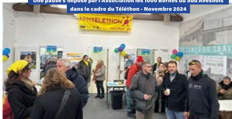
Une pause s'impose par l'Association les 1000 Bornes du Sud Avesnois dans le cadre du Téléthon - Novembre 2024