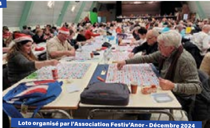
Loto organisé par l'Association Festiv'Anor - Décembre 2024