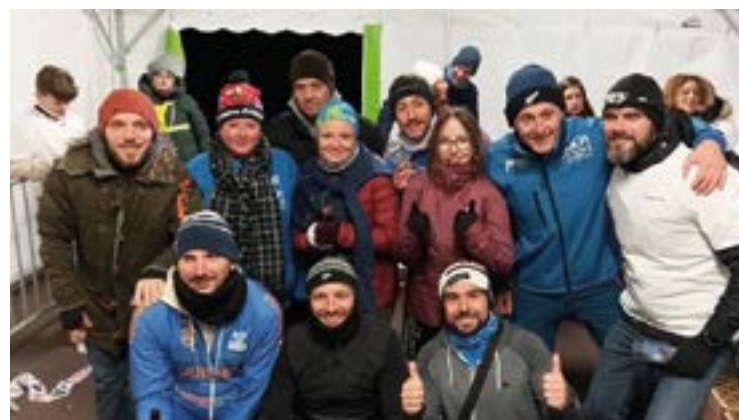
La Givrée Anorienne par l'Association Esprit Trail d'Anor - Novembre 2024