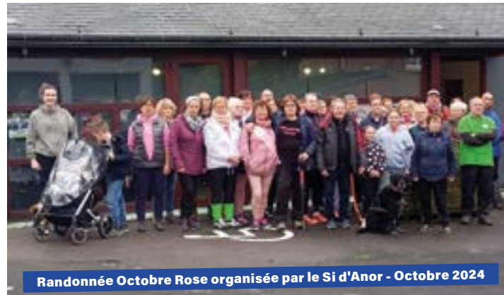
Randonnée Octobre Rose organisée par le Si d'Anor - Octobre 2024