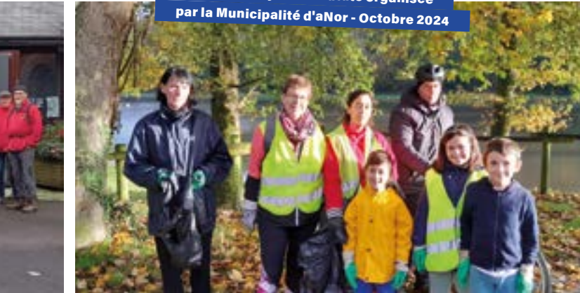
Opération Nettoyons la Natute organisée par la Municipalité d'aNor - Octobre 2024