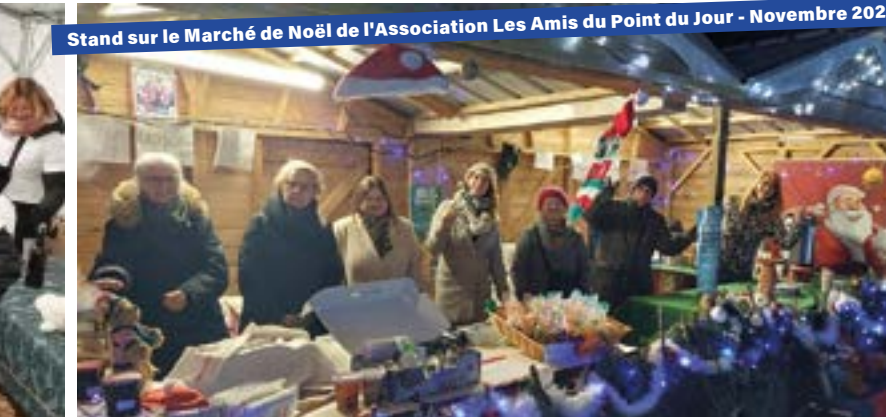
Stand sur le Marché de Noël de l'Association Les Amis du Point du Jour - Novembre 2024