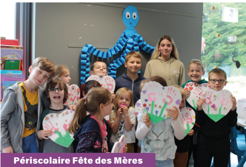
Périscolaire Fête des Mères