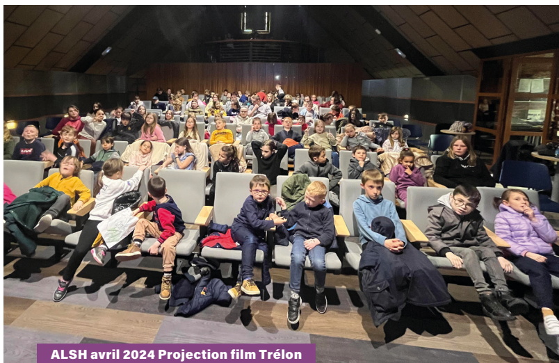
ALSH avril 2024 Projection film Trélon