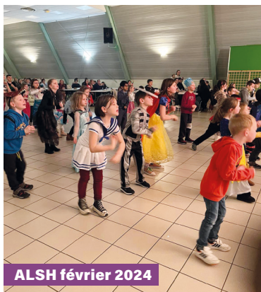
ALSH février 2024