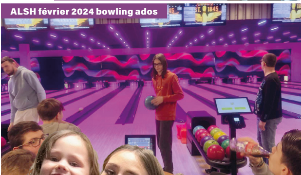
ALSH février 2024 bowling ados