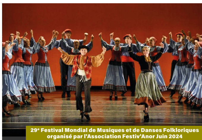
29 e Festival Mondial de Musiques et de Danses Folkloriques organisé par l'Association Festiv'Anor Juin 2024