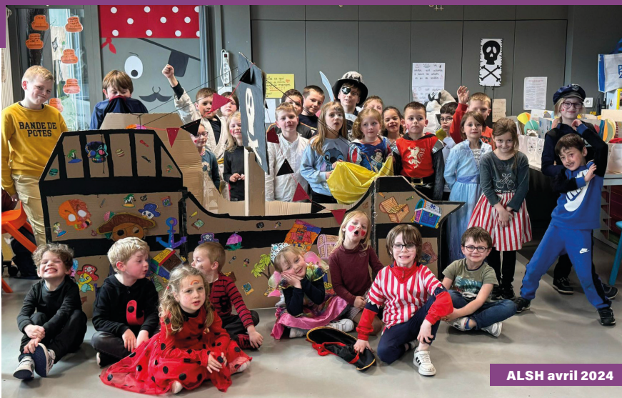
ALSH avril 2024