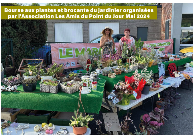
Bourse aux plantes et brocante du jardinier organisées par l'Association Les Amis du Point du Jour Mai 2024