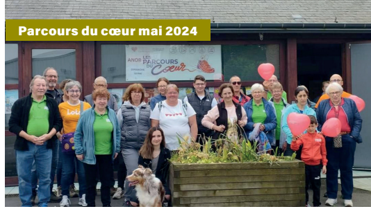
Parcours du cœur mai 2024