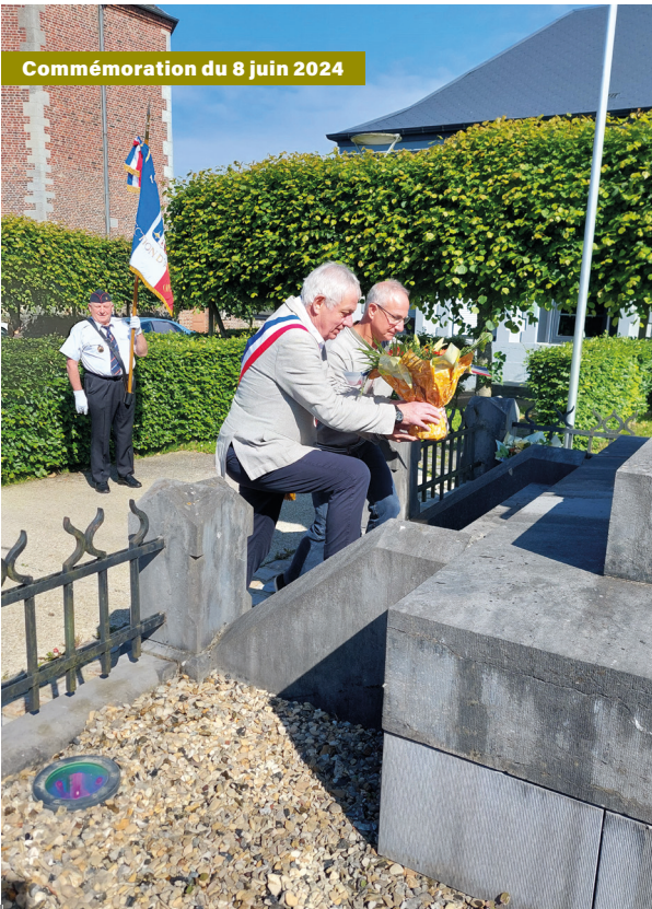
Commémoration du 8 juin 2024