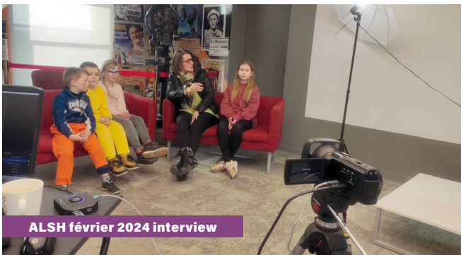
ALSH février 2024 interview