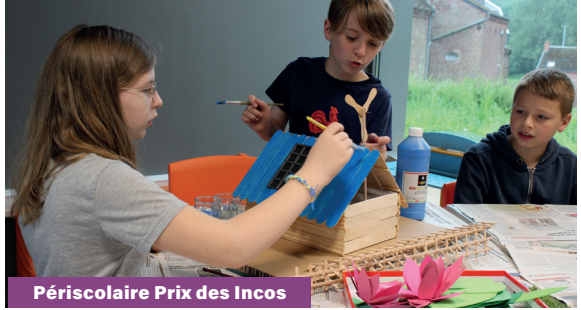
Périscolaire Prix des Incos