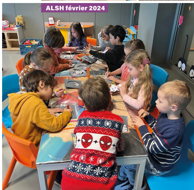
ALSH février 2024