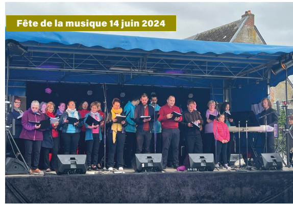
Fête de la musique 14 juin 2024