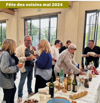
Fête des voisins mai 2024