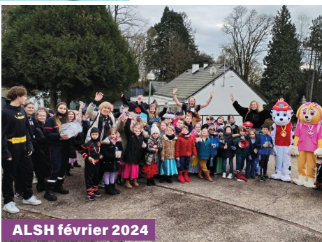
ALSH février 2024