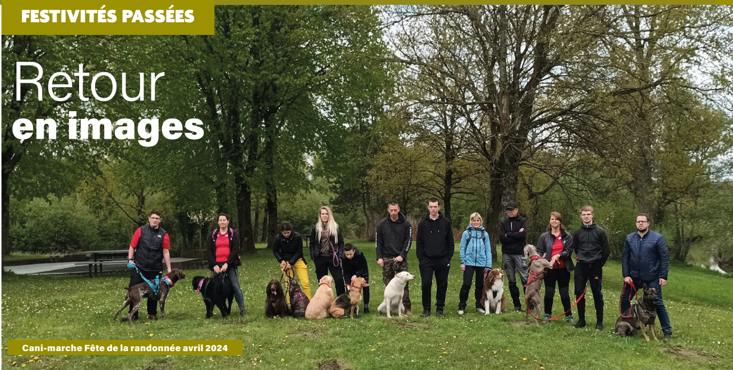
Cani-marche Fête de la randonnée avril 2024