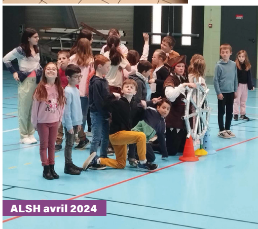
ALSH avril 2024