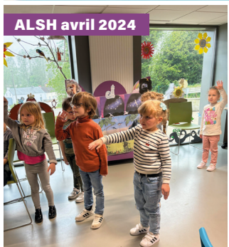
ALSH avril 2024