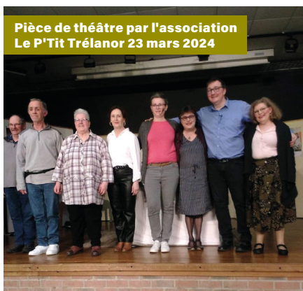
Pièce de théâtre par l'association Le P'Tit Trélanor 23 mars 2024