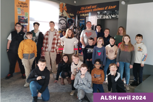
ALSH avril 2024