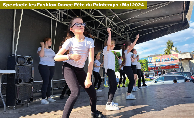
Spectacle les Fashion Dance Fête du Printemps : Mai 2024