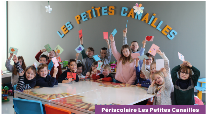
Périscolaire Les Petites Canailles