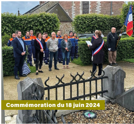
Commémoration du 18 juin 2024