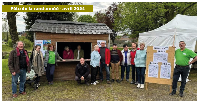
Fête de la randonnée - avril 2024