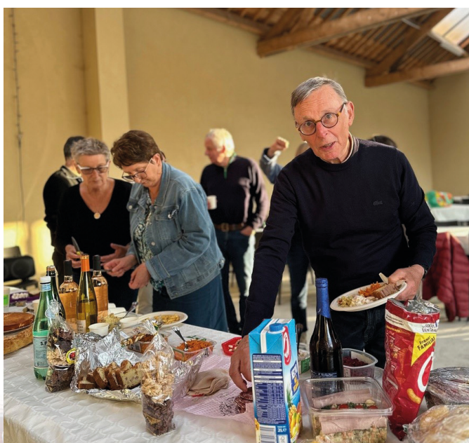
Cette année, les nouveaux résidents ont pu participer à ce moment convivial de la Fête des Voisins. D'autres moments seront programmés régulièrement à l'initiative des habitants.

Rendez-vous le 4 e dimanche de chaque mois de 9h30 à 12h Marché de la Verrerie Blanche