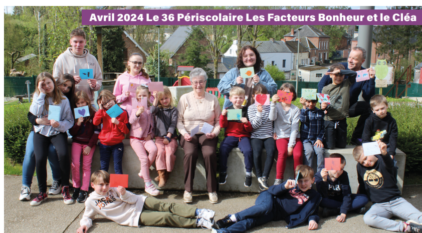
Avril 2024 Le 36 Périscolaire Les Facteurs Bonheur et le Cléa