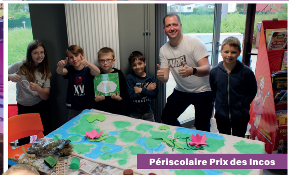
Périscolaire Prix des Incos