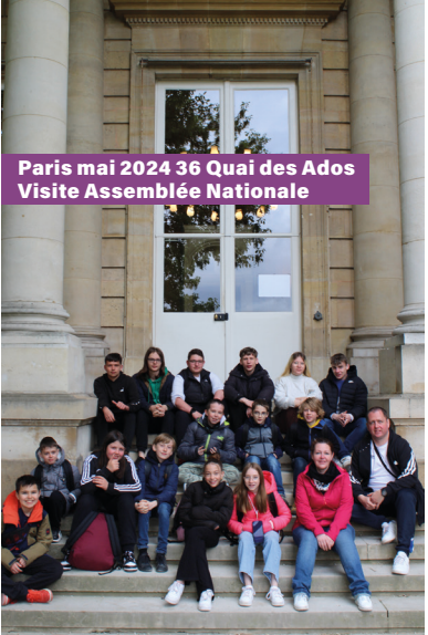
Paris mai 2024 36 Quai des Ados Visite Assemblée Nationale