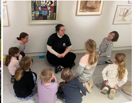
ALSH avril 2024 Visite MuMo