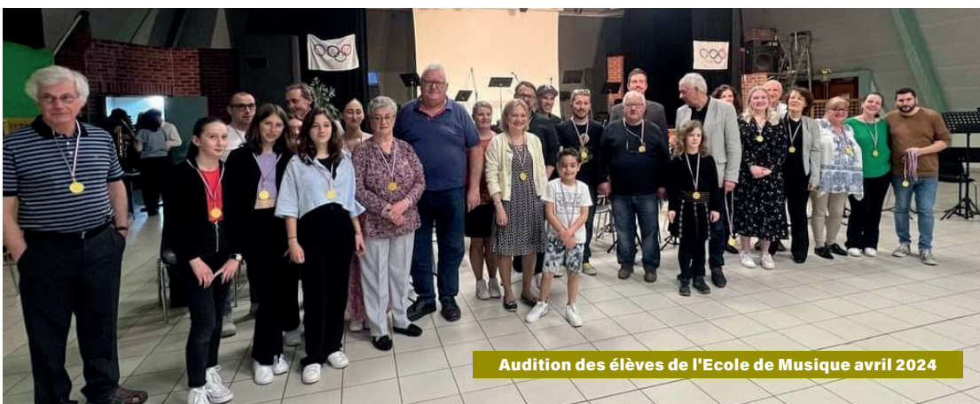
Audition des élèves de l'Ecole de Musique avril 2024