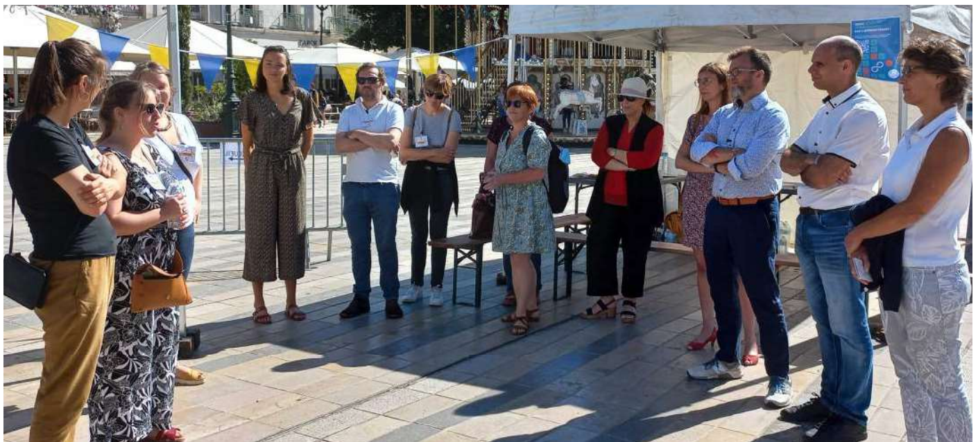
Étape Orléans 2022 - Des partenaires engagés pour les jeunes