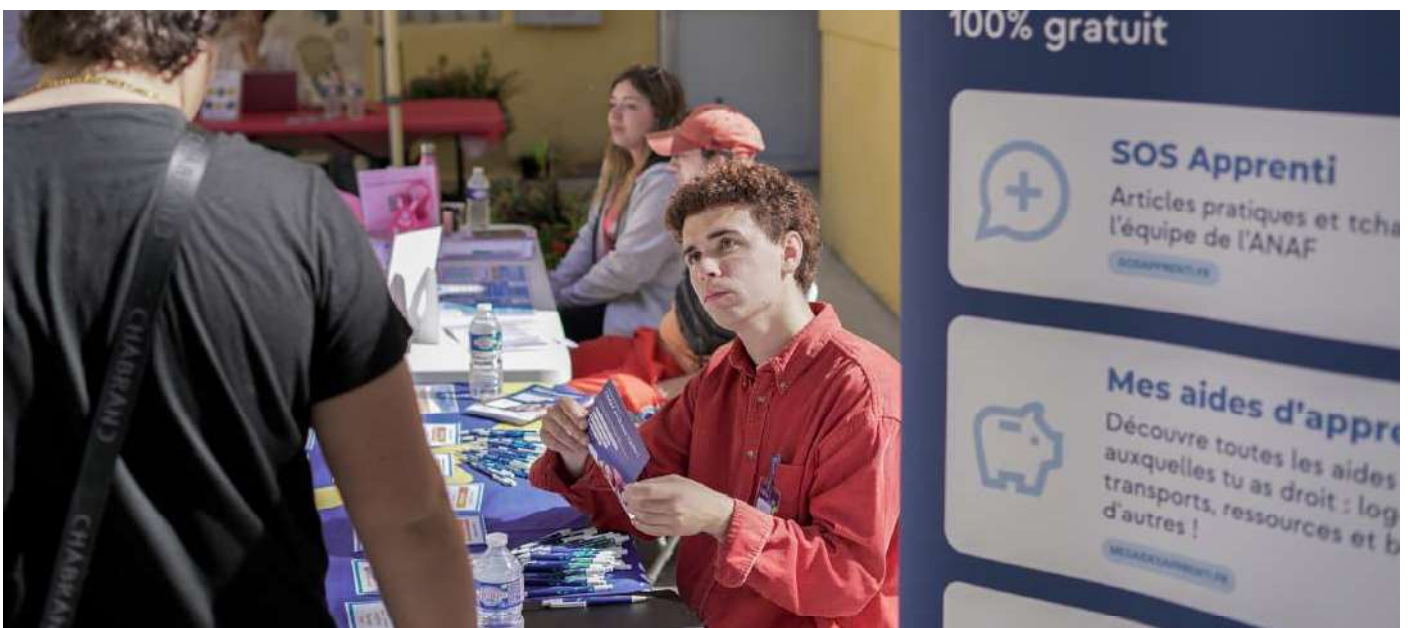
Étapes en Provence-Alpes-Côte d'Azur 2023 - Stand d'accueil