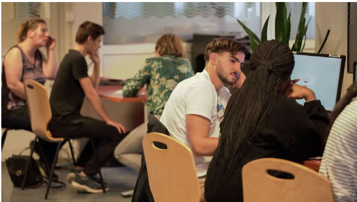
Étapes en Provence-Alpes-Côte d'Azur 2023 - Espace coaching

En diffusant le projet, vous permettez à de nombreux jeunes de se faire accompagner. Un kit de com' sur chaque étape est disponible sur le site : autourdesapprentis.fr .