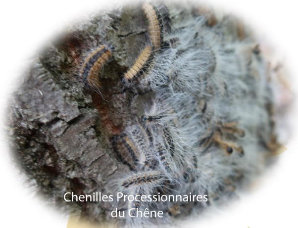
Chenilles Processionnaires du Chêne

Attention, il ne faut pas la confondre avec la processionnaire du pin ou le Bombyx cul-brun.