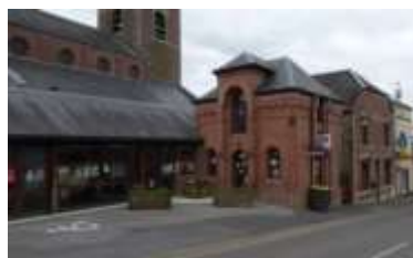
L'office de tourisme