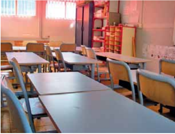
• Classes dédoublées et équipement nouveau mobilier Septembre 2018 « Ecole du Centre Le Petit Verger »