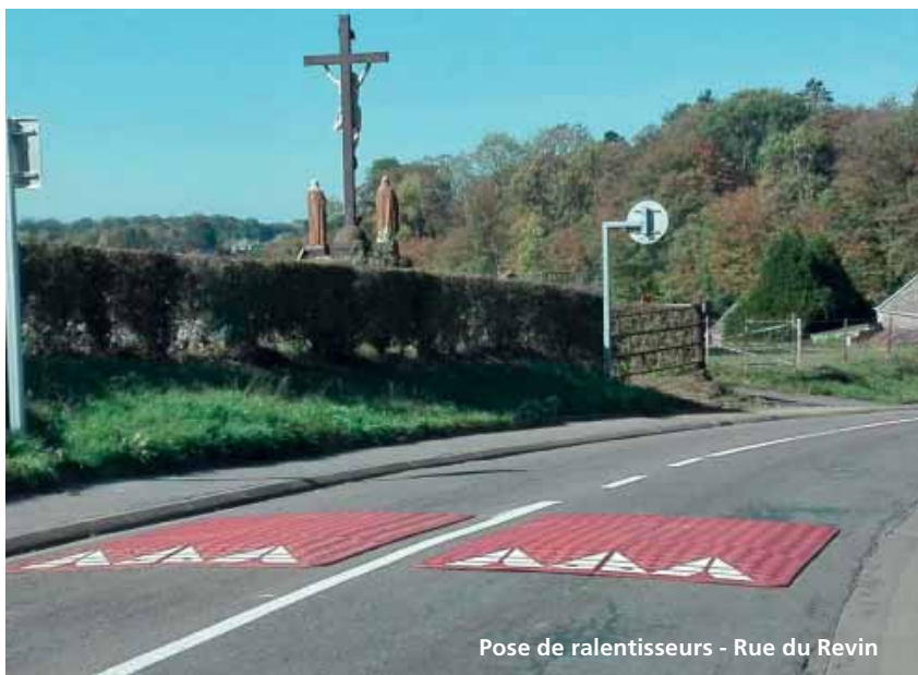
Pose de ralentisseurs - Rue du Revin

Cette année 2018, j'ai proposé au Conseil Municipal de faire l'acquisition de ralentisseurs de type coussins-berlinois (démontage facile). C'est ainsi que Rue du Revin et Rue Saint-Roch, des bandes rugueuses et un ralentisseur ont été installés dans le voisinage immédiat de l'école maternelle Les P'tits Loups. La Ruelle Vitou a également été équipée d'un ralentisseur (ces ralentisseurs sont posés à titre expérimental afin de juger de leur opportunité et de les concrétiser en ralentisseurs fixes). Rue de Milour, dans la partie haute, ont été installés des panneaux stop à l'intersection avec la Rue du Maka et la Rue Victor Delloue.