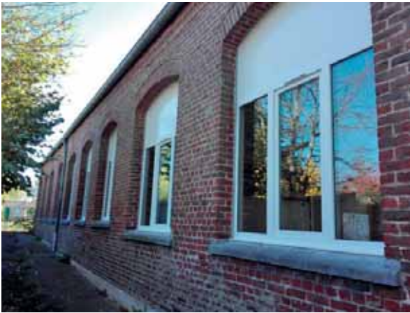
• Changement des fenêtres par les Services techniques Septembre-octobre 2018 « Ecole du Centre Le Petit Verger »