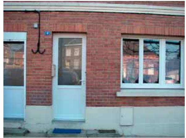
• Changement de fenêtres et porte chez un locataire de la Mairie Services techniques - Octobre 2018 Place du Poilu