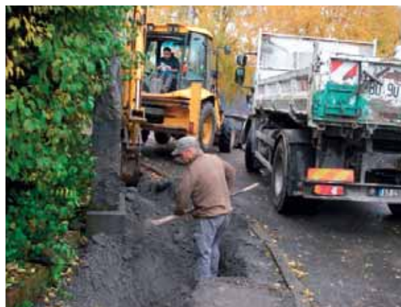
• Tranchée de connexion pour les centrales photovoltaïques - Services techniques - Septembre à novembre 2018 Espace François Mitterrand