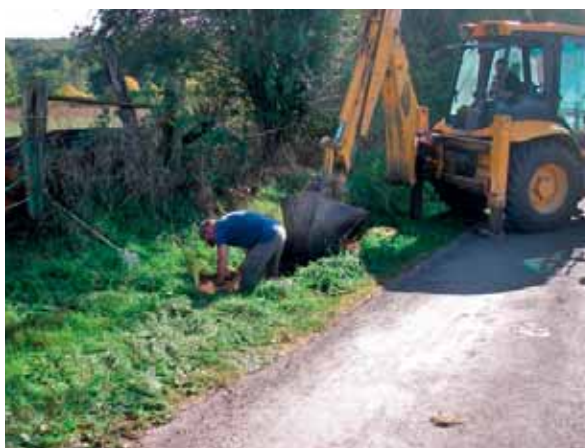
• Curage de fossé - Services techniques - Septembre 2018 Rue de la Chapelle Blanche