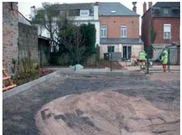
• Réalisation d'un parking public - Services techniques Octobre-novembre 2018 Rue du Petit Canton