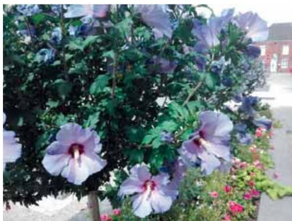
• Fleurissement d'été - juillet 2018 Mairie