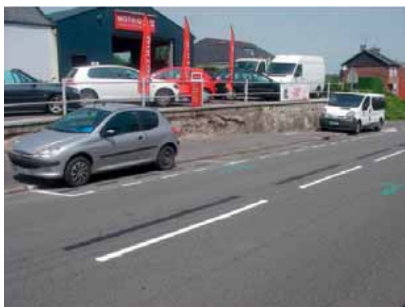
• Marquage des stationnements près du garage - juillet 2018 Rue du Maréchal Foch