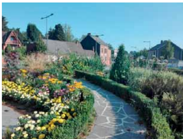
• Fleurissement d'été - juillet 2018 Rond-point de la Cloche d'Or