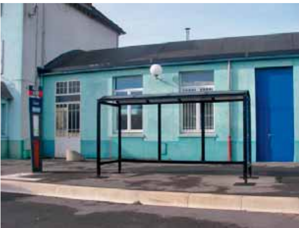
• Installation d'un nouvel abri-bus - Services techniques Octobre 2018 Gare d'Anor