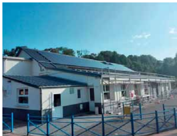
• Panneaux photovoltaïques - juillet 2018 Espace F. Mitterrand - Ancien cinéma et Salle Beauné