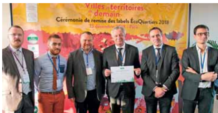
Photo souvenir prise dans les locaux de l'UNESCO à Paris avec une partie de l'équipe

Le projet de requalification de la Verrerie Blanche, qui se veut " un quartier fier de son passé mais tourné vers l'avenir " répond en effet aux principes qui portent sur tous les domaines de la ville durable : la qualité du cadre de vie, la sobriété énergétique, la mobilité, l'offre diversifiée de logements, le patrimoine naturel et culturel, le développement économique et valorisation de la biodiversité, afin de concevoir des quartiers plus responsables et solidaires.