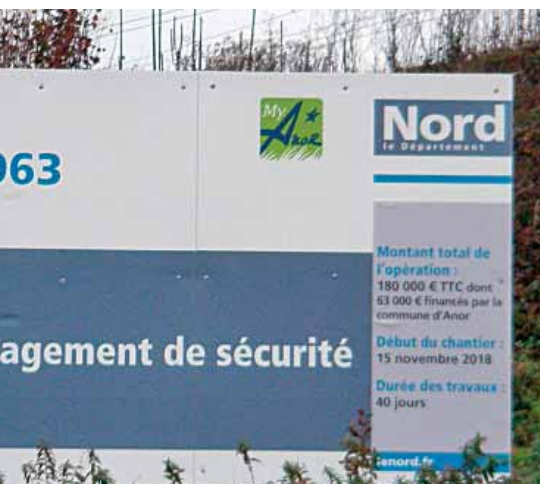
« Ecluse » du Pont de la Rue d'Hirson

Par ailleurs, nous avons associé les services de la Gendarmerie Nationale afin d'exercer des contrôles réguliers.