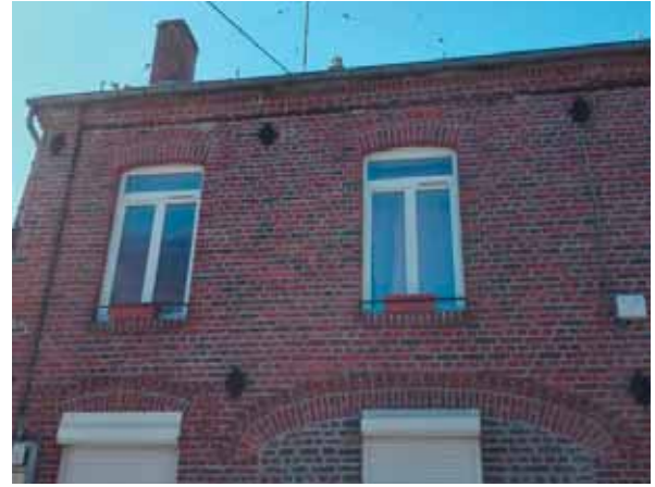
• Changement de fenêtres chez un locataire de la Mairie Services techniques - Octobre 2018 Rue Pasteur